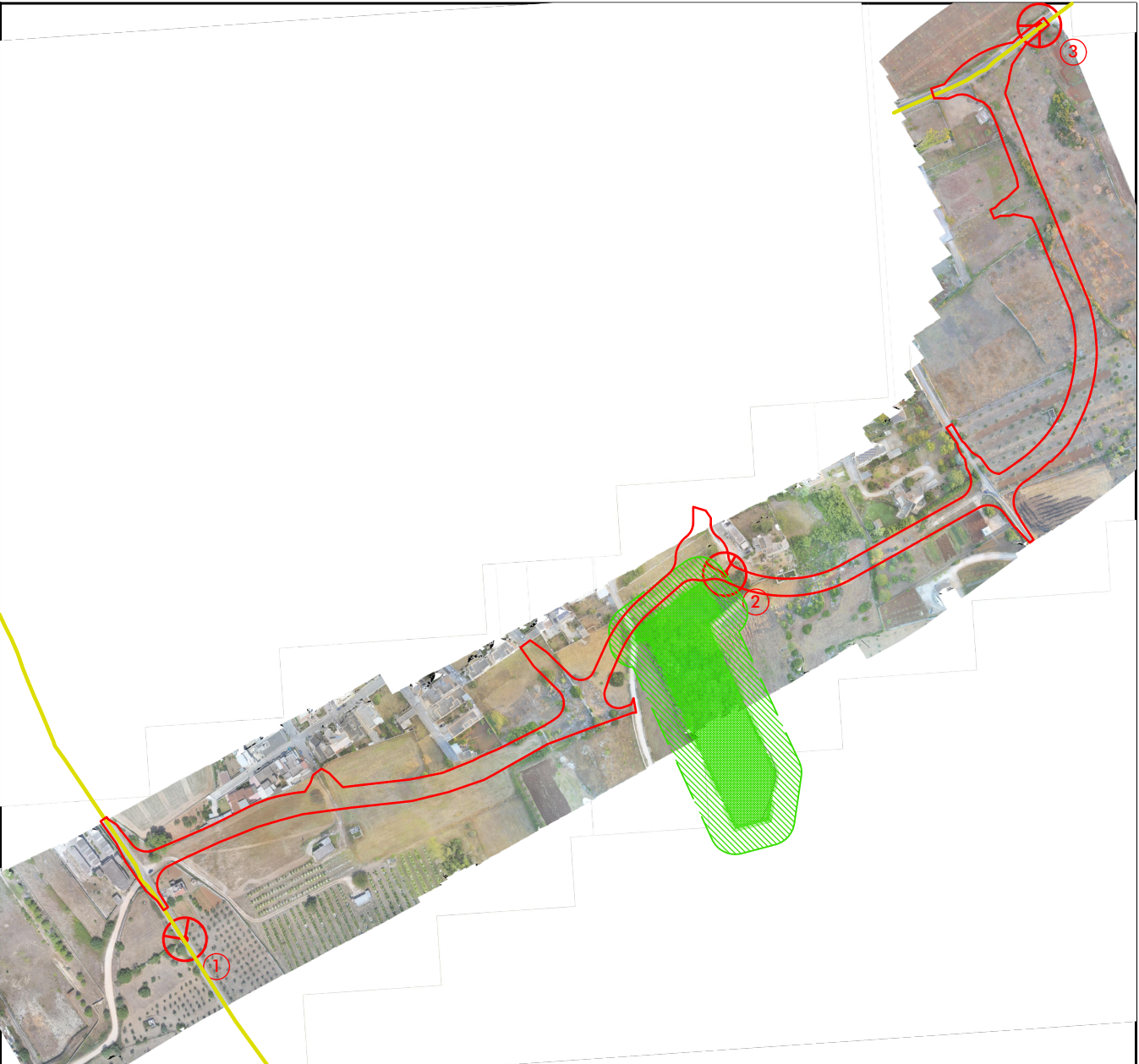
CASTIGLIONE - ORTOFOTO CON PUNTI DI RIPRESA FOTOGRAFICA SCALA 1:5000