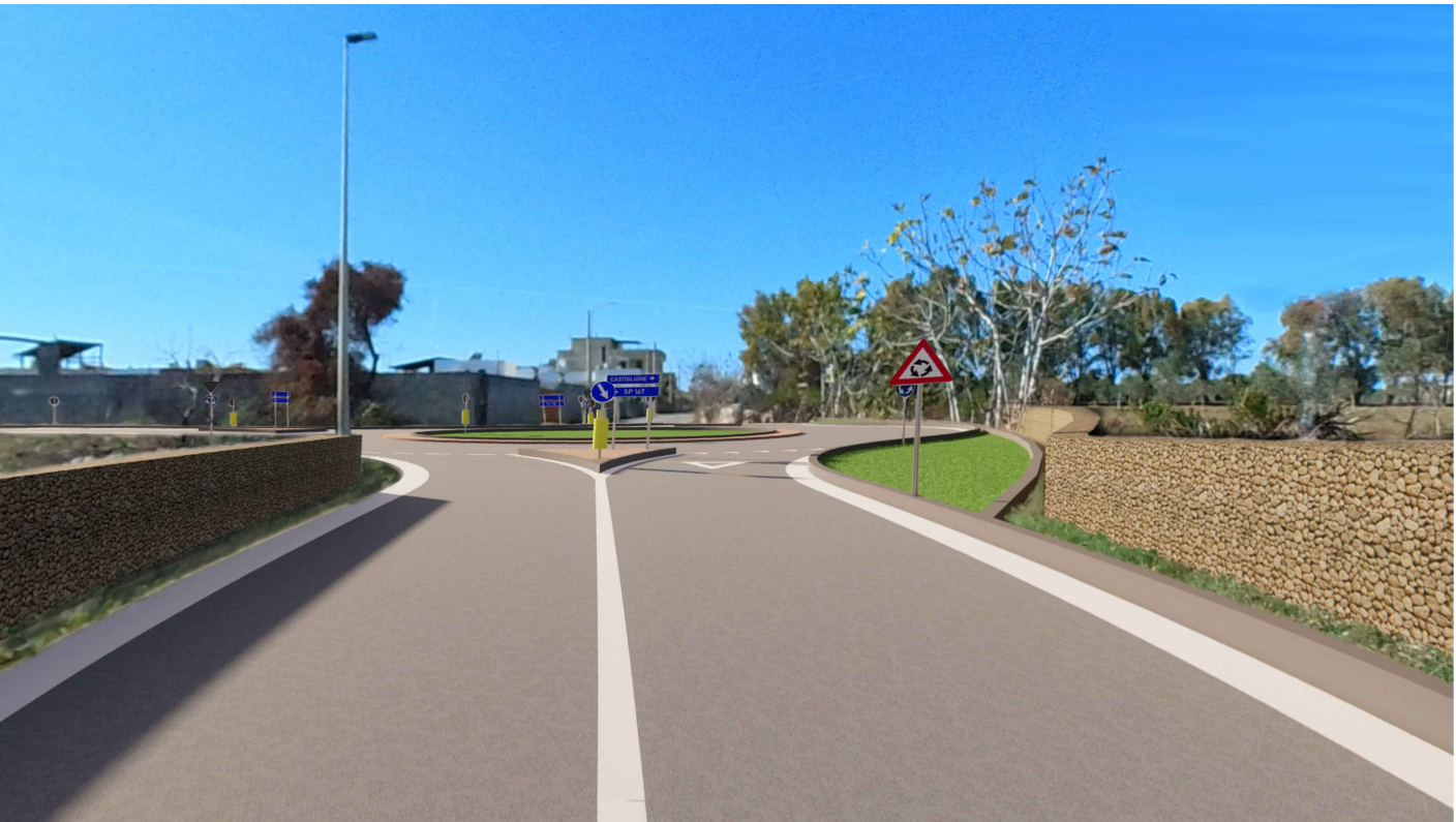
FOTOINSERIMENTO (2) - vista da lato nord-est