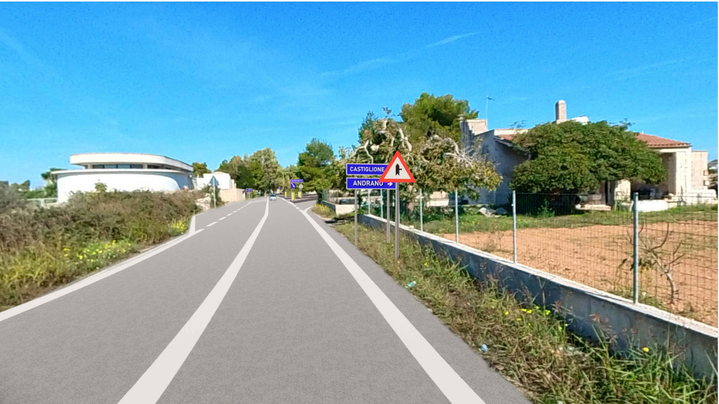
FOTOINSERIMENTO (1) - vista da lato sud-est