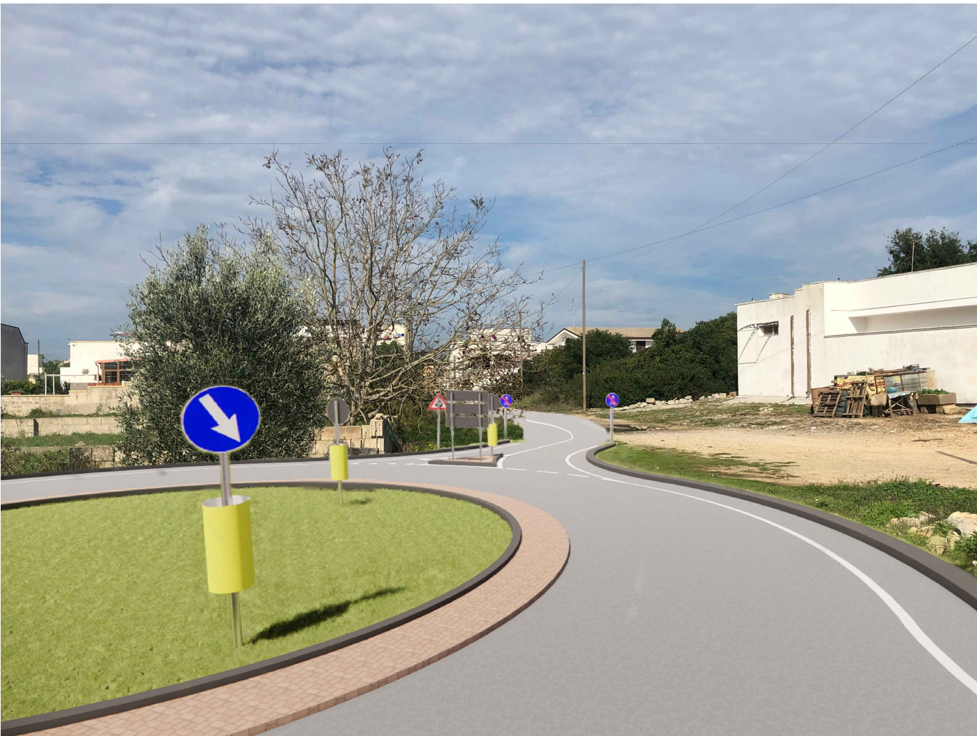
FOTOINSERIMENTO (3) - vista da lato sud